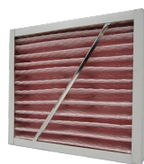
FMK F7-10 ZUL dez. 800/870