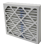
FMK M5-2 ABL dez. 300